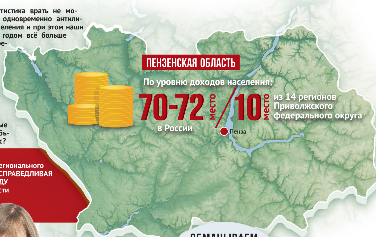
Фото: 123rf.com, pixabay.com, инфографика: Алексей Беленёв

Малый бизнес давно страдает от чрезмерного регулирования, нередко – и от поборов чиновников. Предпринимателям нужны конкретные меры поддержки: предоставление муниципальных помещений в аренду по разумным ценам в обмен, например, на льготные услуги для уязвимых слоёв населения, консультативная помощь с аудитом, льготные кредиты для развития бизнеса, помощь в рекламе и продвижении товара.