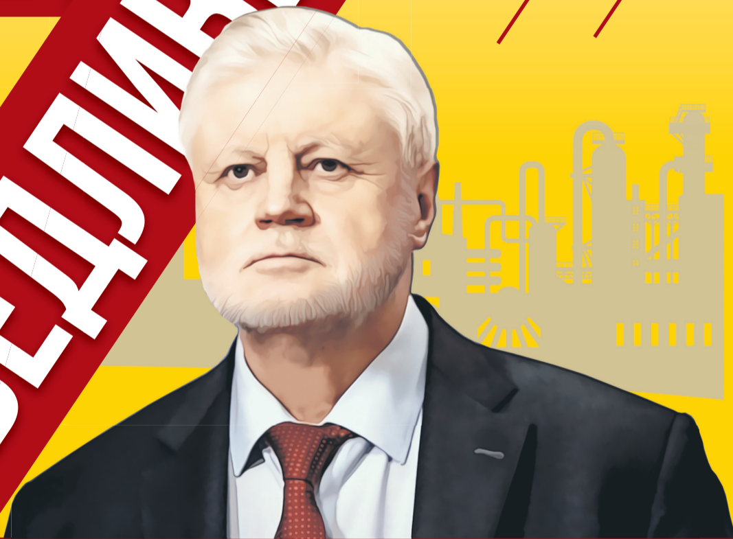
Фото: из архива Партии СРЗП, 123rf.com. Коллаж: Алексей Беленёв.

Как именно Пензенская область может преодолеть последствия санкций?