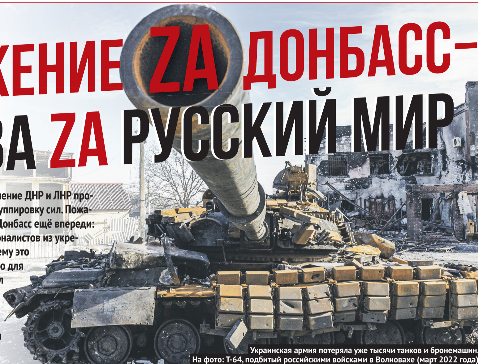
Украинская армия потеряла уже тысячи танков и бронемашин. На фото: Т-64, подбитый российскими войсками в Волновухе (март 2022 года)