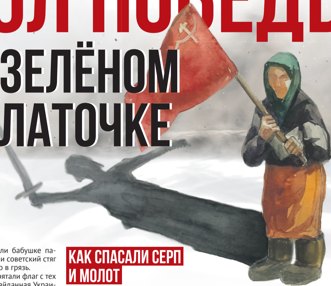
Рисунок Елены Рябоваловой, коллаж Алексей Беленёв